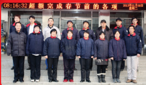
08:16:32 超额完成春节前的各项