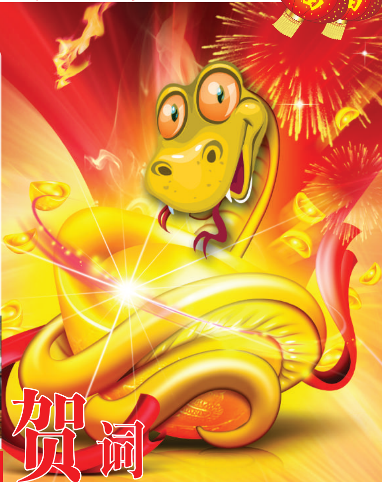
董事长：郭继东 敬贺 2013年春节