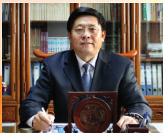
北京日光精细(集团)公司

2013年，让我们坚定信念，坚持不懈，感恩包容，开拓进取，和谐向上，为实现每个日光人的愿望和理想而奋斗！